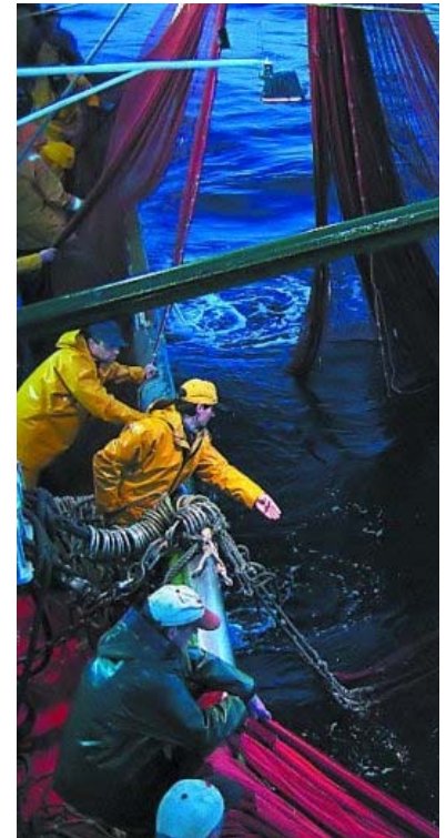
Toma de muestras por Azti.